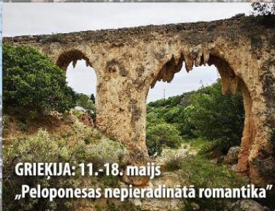
GRIEKIJA: 11.-18. maijs „Peloponesas nepieradinātā romantika”