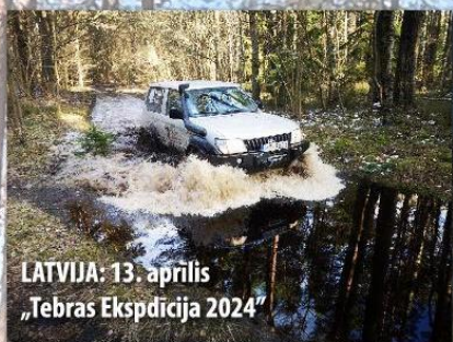
LATVIJA: 13. aprīlis „Tebras Ekspedīcija 2024”