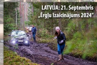
LATVIJA: 21. Septembris „Ērgļu Izaicinājums 2024”