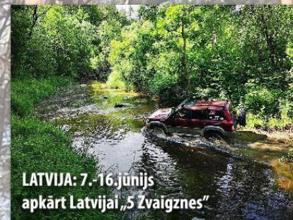
LATVIJA: 7.-16.jūnijs apkārt Latvijai „5 Zvaigznes”