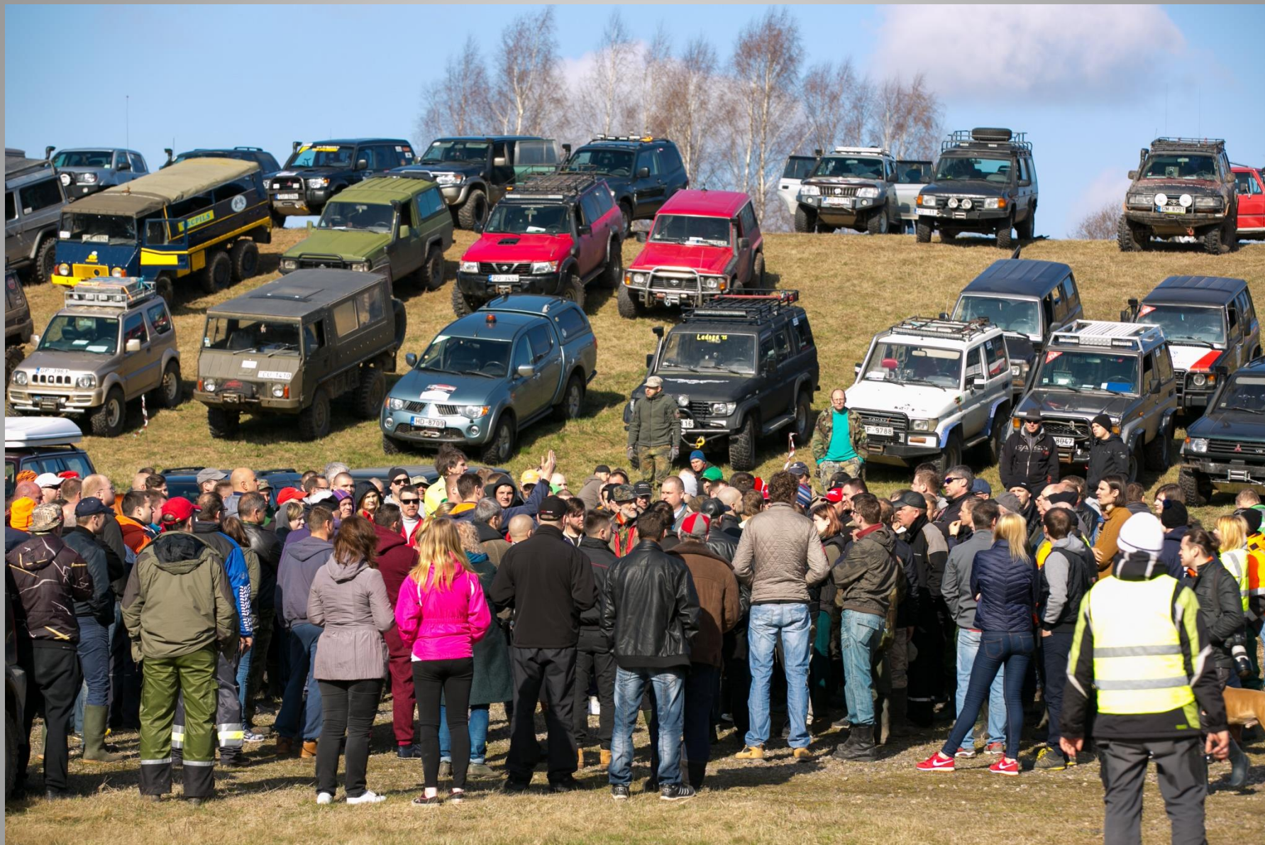
Tebras Ekspedīcija. Anno 2000.