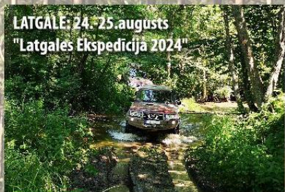
LATGALE: 24.-25.augusts „Latgales Ekspedīcija 2024”