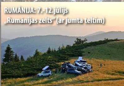
RUMĀNIJA: 7.-12.jūlijs „Rumānijas zelts” (ar jumta teltīm)