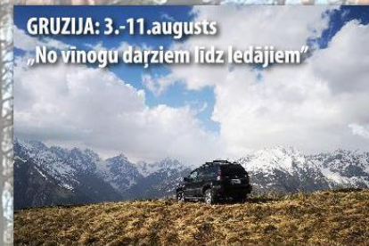
GRUZIJA: 3.-11.augusts „No vīnogu dārzjiem līdz ledājiem”