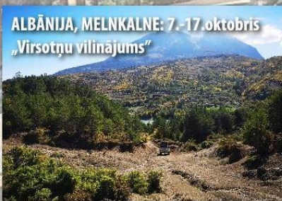
ALBĀNIJA, MELNKALNE: 7.-17.oktobris „Virsoņu vilinājums”