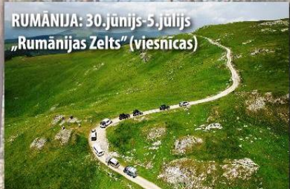
RUMĀNIJA: 30.jūnijs-5.jūlijs „Rumānijas Zelts” (viesnīcas)